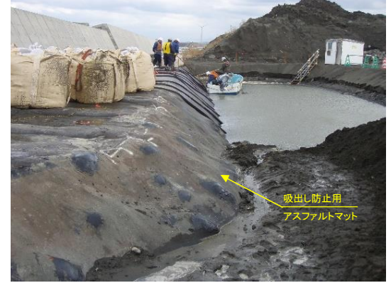
写真-3 捨石の凹凸へのなじみ