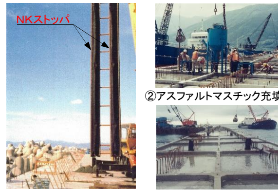
①NKストップパを目地に建て込み ③充填完了