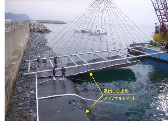
写真-1 アスファルトマット敷設状況