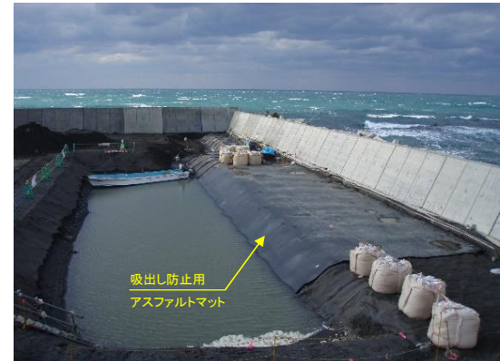
写真-2 敷設後のアスファルトマット